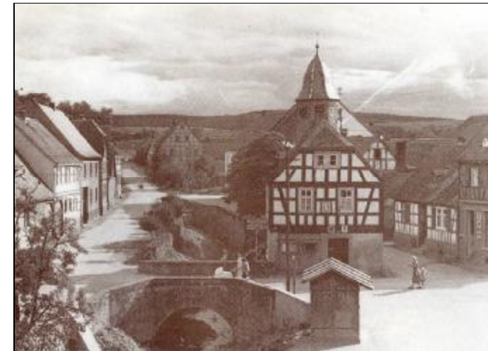
Rathaus und alte Brücke von Schlierbach um 1954.