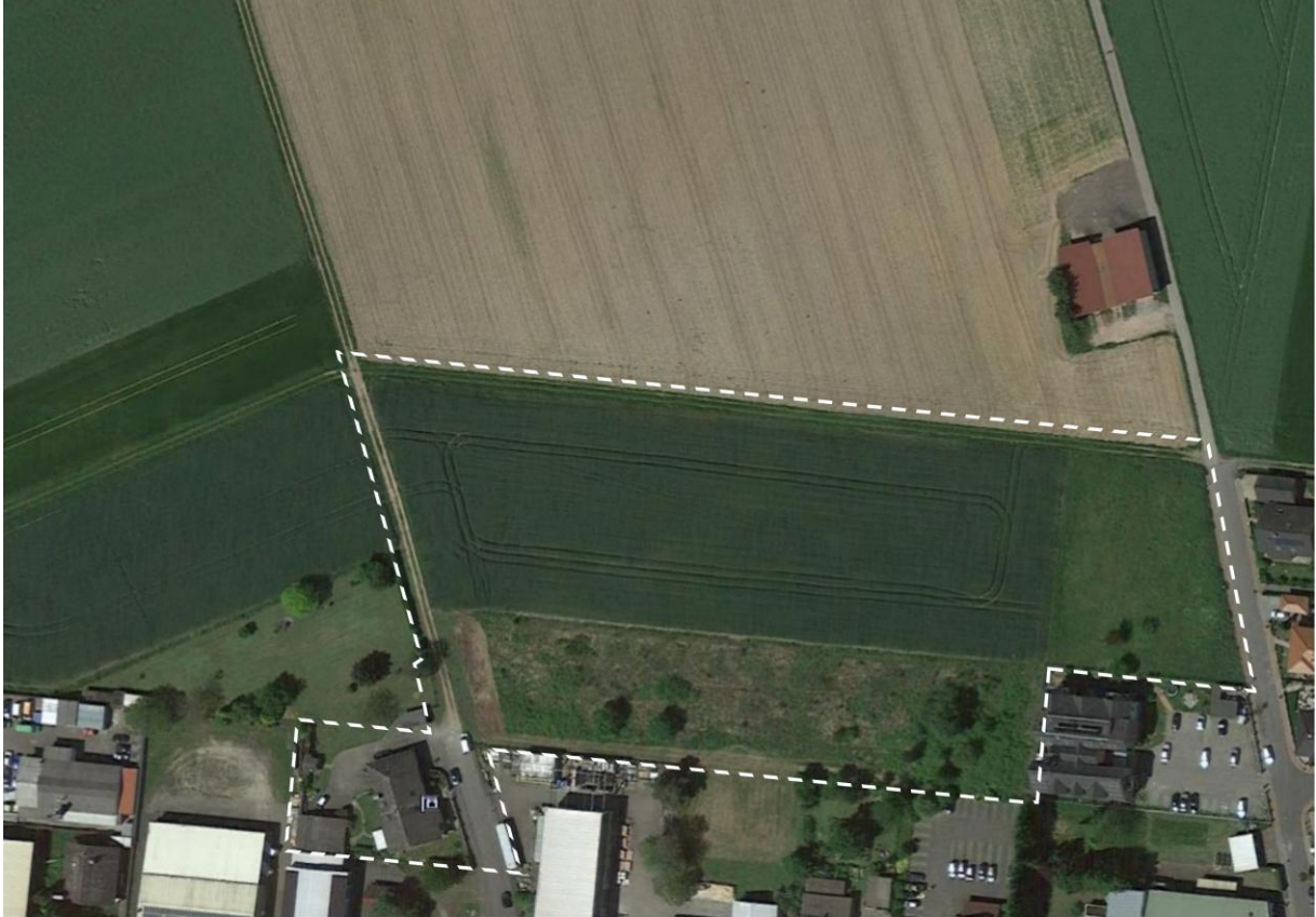
Abbildung 1: Luftbildauszug des Plangebietes

Die Bestandssituation im Plangebiet (gestrichelte, weiße Grenzlinie) und seine räumliche Einbindung in die Umgebungsstrukturen ist dem nachstehenden Luftbildauszug (Quelle: Google Earth, unmaßstäblich) zu entnehmen. Das dargestellte Strukturpotenzial entspricht der Biotopausstattung zum Zeitpunkt der aktuellen Begehungen. Allerdings ist anzumerken, dass der Gehölzbestand im Bereich der verbuschten Brache im Süden des Plangebietes während der Wintermonate tlw. gerodet wurde..