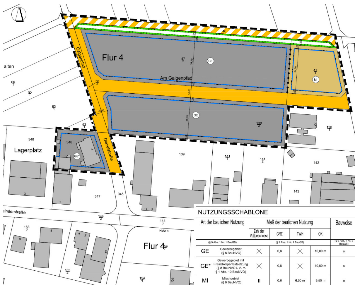
Abbildung 2: Entwurfsplanung

Auf dem nachstehenden Kartenauszug (INFRAPRO, 2019) ist die angestrebte Entwicklungssituation im Plangebiet zu ersehen.